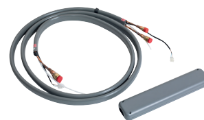
Verlängerungskit 4 m